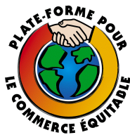
PLATE-FORME POUR LE COMMERCE ÉQUITABLE